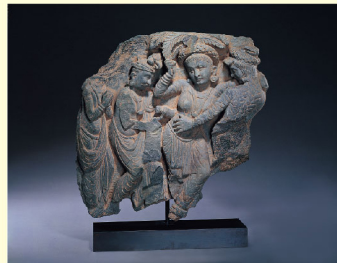
《佛陀誕生浮雕》 世界宗教博物館典藏

在《佛陀誕生浮雕》中可以看到佛陀的誕生，小朋友請你找找看佛陀在哪裡？找到請圈起來！